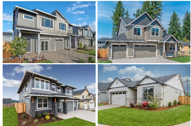
Holt 社の戸建住宅商品

積水ハウスグループは、2020年に創業60年を迎え、次の30年に向けて、“「わが家」を世界一幸せな場所にする”というビジョンを掲げ、その実現のため、日本で培った住宅建築技術とライフスタイル提案による高付加価値の提供等といった積水ハウステクノロジーの普及を進めています。