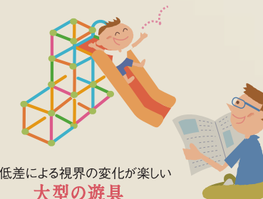
高低差による視界の変化が楽しい 大型の遊具