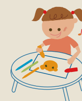
きちんと座って学びの一步 座卓テーブル