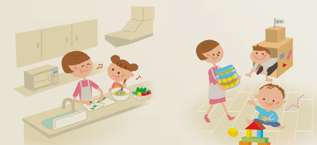
家事への興味を引き出すワイドなキッチン