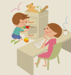
小さな頃から“はじめ”を学ぶ おもちゃ箱収納