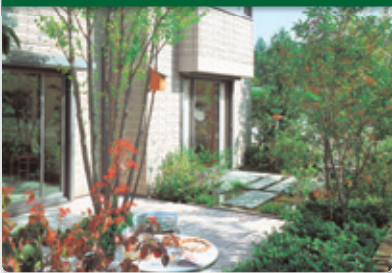
「5本の樹」計画の推進