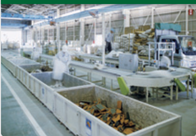
次世代型ゼロエミッションシステムの構築と活用