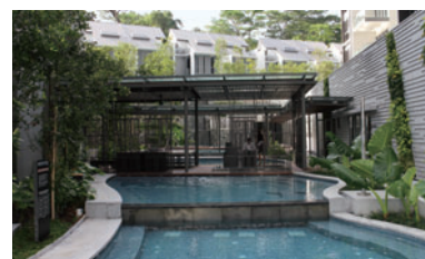
自然と親しめる共有空間 「ヒルスタ」

また、2014年に開始した分譲オフィスの開発プロジェクト「ウッズスクエア(Woods Square)」でも、「緑と親しむオフィス」という新コンセプトに沿って、緑に囲まれてリラックスしたり交流したりできるオープンスペースを充実させ、新しい価値を生み出せる職場空間の創造に取り組んでいます。