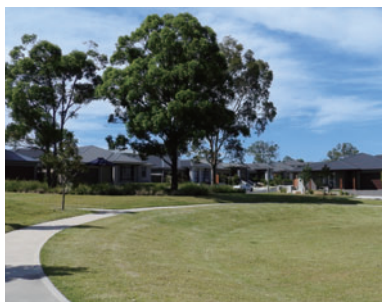
既存の地形、樹木を残した「ザ・ヘリミテージ」

同国の宅地開発では一般的にまず樹木をすべて伐採して更地にしますが、当社が現在、シドニー郊外に開発・販売中の大規模分譲宅地「ザ・ヘリミテージ(The Hermitage)」は、旧来の地形、既存樹木を詳細に調査した上で、本来の自然を極力残すべく宅地や道路、公園などの配置を計画。「経年美化※1」の思想のもと、地域の生態系や景観の保全とともに、幅広い世代の人々と自然がふれあう場としての「SATOYAMA」によってコミュニ