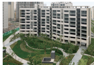
「5本の樹」計画に基づく植栽 (太倉「裕沁庭」プロジェクト)

建ち並ぶ、総戸数511戸の「裕沁庭」プロジェクトが進行中。敷地全体には、当社の「5本の樹」計画※2のコンセプトに基づいた自然の景観を形成。在来樹種を植え、散歩道をつくり、自然とふれあう暮らしを住人の方々に提供できるよう、開発を進めています。