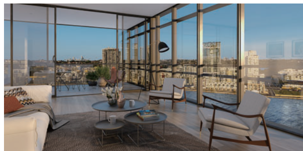
「ザ・ウォーターフロント」の「サバナ」棟

※1 経年美化：周囲の自然環境や原風景を生かした景観づくりなどで、歳月を重ねるごとに美しくなるまちづくりの思想。