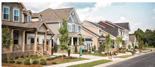
エコセレクト住宅で構成された「ウェンデル・フォールズ」

2013年にノースカロライナ州で開発した郊外型宅地「ウェンデル・フォールズ(Wendell Falls)」は、断熱・節水効果が高く、屋内空気環境に配慮したエコセレクト住宅で構成。米国の平均的住宅よりもエネルギー効率に38%も高いコミュニティであると、住宅のエネルギー効率に関する全米基準「HERS Index」の認定を受けています。