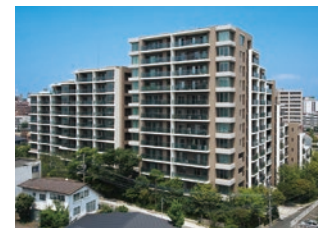
「グランドメゾン浄水ガーデンシティサウスフォレスト」