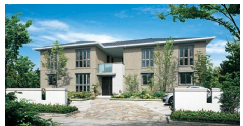
2階建て賃貸住宅「プロムープ」