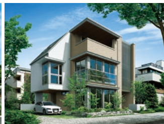
鉄骨3・4階建て住宅「ピエナ」