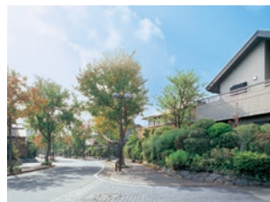
「シーサイドももち」の「経年美化」のまちなみ