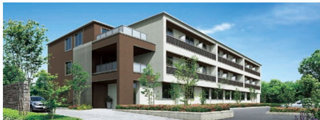
サービス付き高齢者向け住宅「セレブリオ」