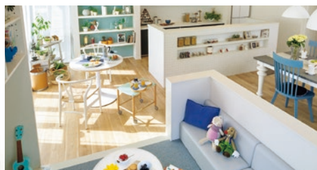
リノベーション施工例