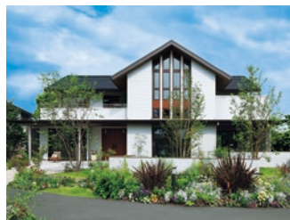
木造住宅シャーウッド「グラヴィス・ヴィラ」