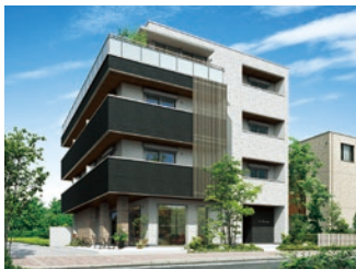
3・4階建て賃貸住宅「ベレオ」