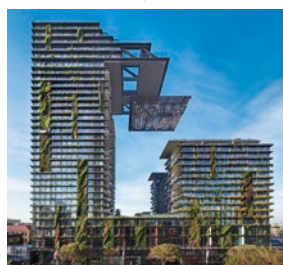
オーストラリア「セントラルパーク」

海外における戸建住宅の請負、分譲住宅および宅地の販売、マンションおよび商業施設等の開発・分譲