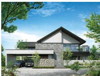
鉄骨2階建て住宅「イズ・ステージ」