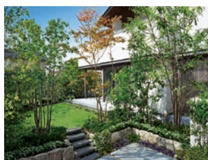
「5本の樹」計画による外構・造園施工例