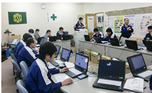
被災地事業所の会議室を全国からの支援スタッフの詰所として活用

加えて、当社定休日にオーナー様からのご相談や緊急の修理依頼に対応する「休日受付センター」を大阪市と横浜市に設置。平時より一体・補完運営を行い、大規模災害発生時などで一方が稼働できない状況下では、他方が補完運営する体制を整え、被災地域のカスタマーズセンター、リフォーム営業所と連携し「災害受付センター」としての役割を担い、オーナー様をサポートしています。