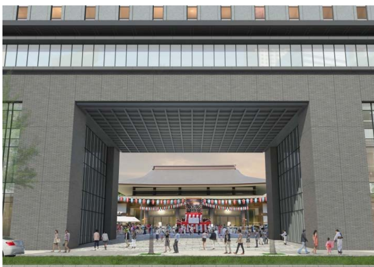
外観イメージ（参道部）