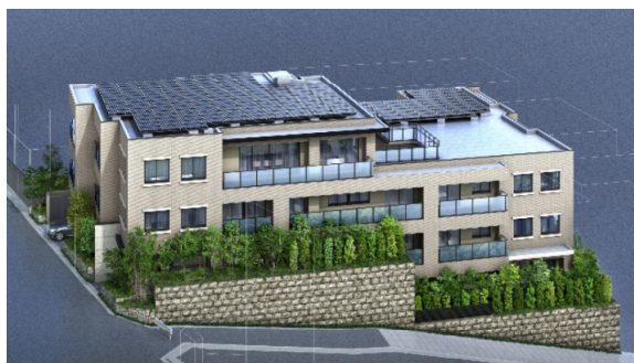
「グランドメゾン覚王山菊坂町」 (外観完成予想CG)

一般的に集合住宅では住戸数に対して相対的に屋根面積が小さく、1戸あたりの太陽光パネルの設置面積が不足する等の理由から、国の定めるZEH基準を満たすことが困難とされてきました。このため、集合住宅のZEH化は現時点で国の普及目標の対象外となっています。本物件は、省エネと創エネにより、国内で初めて全住戸でZEH基準を達成しました。「省エネ」としては、LED照明等の各種省エネ設備を採用。窓のアルミ樹脂複合サッシにアルゴンガス封入複層ガラスを採用するなど、開口部の断熱性能を従来比2倍に高め住戸単位の断熱性能を約1.4～1.5倍に高めました。