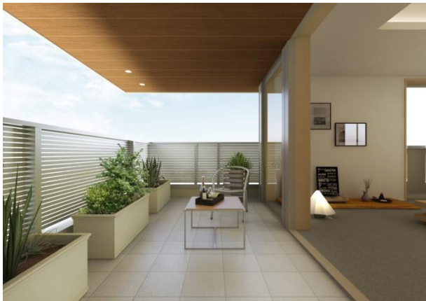
開放感のあるスローリビング空間をリアルに体感

積水ハウスは、「スローリビング」をテーマに高級な住宅提案を展開しており、室内と庭とのつながりや四季の移ろいを室内の暮らしに取りこむ設計を強みとしています。季節や時間の変化による室内の雰囲気や、隣地建物との距離とその影の影響、樹木による室内に差し込む木漏れ日の雰囲気など、お客様には平面図からでは伝わりにくい部分を、360度3Dの臨場感ある空間で体験してもらうことで、営業折衝と設計提案の満足度をさらに高めます。また、邸別自由設計によるオリジナルプランのVR用データをお持ち帰りいただけ、自宅でスマホを使いVRの臨場感あふれる空間を体験できることで、家族での住まいづくりの夢や会話を弾ませ、住まいづくりのプロセスをこれまで以上に楽しんでもらうツールとしても活用できます。対面のプレゼンでは、面談後に繰り返し気になる場所を確認することが容易ではありませんでしたが、このシステムでは、何度でもお客様が納得するまで確認することが可能となります。オリジナルプランのリアルな空間体験により、折衝プロセスそのものの満足度がより一層高まります。