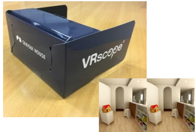
全国の展示場で利用するVR用メガネとVR画像例