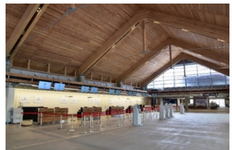
▲（参考）三菱地所におけるCLT使用事例 「みやこ下地島空港ターミナル」