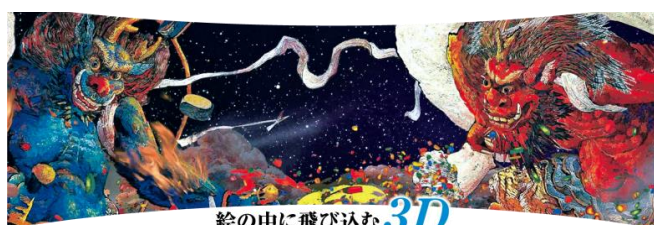
絵の中に飛び込む 3D 世界初！絵の中に飛び込む3D映像

※「絹谷幸二 天空美術館」では、来館者、スタッフなど、美術館を利用するすべての方の安全と安心のため、新型コロナウイルス感染防止に関する取り組みを行っています。詳細はウェブサイトをご覧ください。