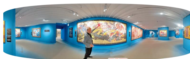
画家とつながる VR 絹谷氏自らが館内やアトリエを案内するVR映像