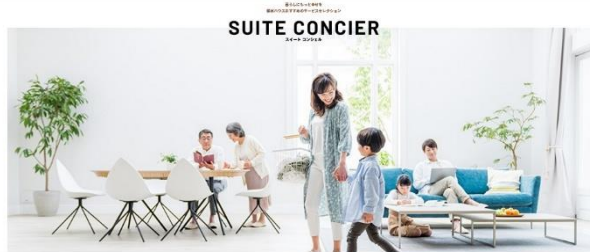
「スイート コンシェル」HP トップページ画像

積水ハウス株式会社は、本日2022年4月15日にオーナー様向け生活サービス紹介サイト「スイート コンシェル」をオープンします。「スイート コンシェル」は、当社オーナー様専用サイト「Net オーナーズクラブ」に会員登録された戸建・賃貸住宅オーナー様とご家族を対象に、暮らしに役立つ、幸せが膨らむサービスを紹介するサイトです。