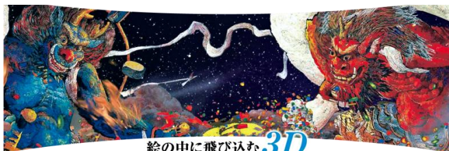
絵の中に飛び込む 3D