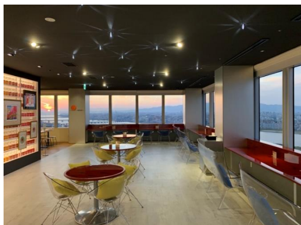
館内 天空カフェ（右）

【開館時間】 10：00-18：00、金曜日・土曜日・祝前日は 10：00-20：00（入館は閉館の 30 分前まで）