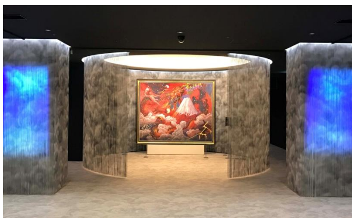
シンボルゾーン（左）

「絹谷幸二 天空美術館」では、来館者、スタッフなど、美術館を利用するすべての方の安全と安心のため、新型コロナウイルス感染防止に関する取り組みを行っています。詳細はウェブサイトをご覧ください。