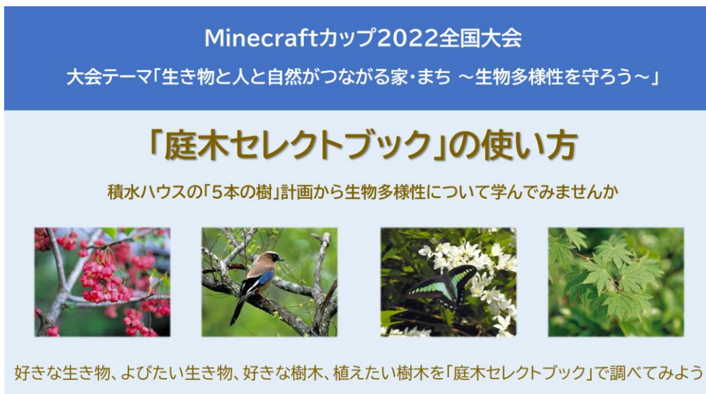
「庭木セレクトブック」使い方リーフレット