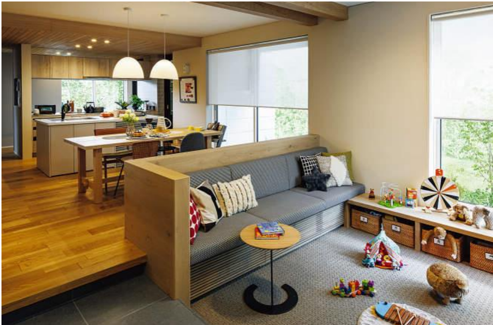
大会参加者向け積水ハウス住宅展示場の見学機会の提供

Minecraft カップ 2022 全国大会 公式サイト https://minecraftcup.com/