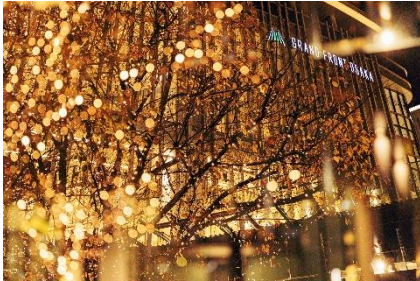
過去実施時の様子

なお、本イベントで使用する電力は、「RE100」※に対応した実質再生可能エネルギー由来となっており(一部エリア除く)、LED 電球も省電力のタイプを採用するなど、環境に配慮したイルミネーションを実現しています。