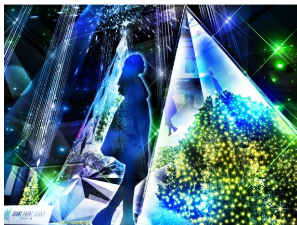
内部の色が変化し、表情を変える「Infinity Wish Tree」(イメージ)