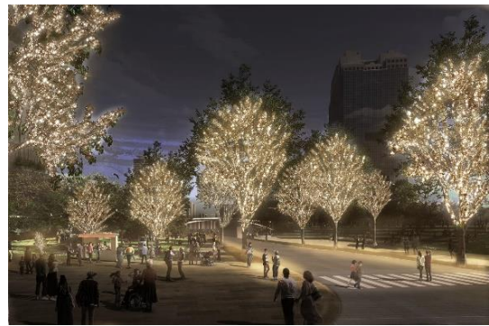
▲「Champagne Gold Illumination」過去開催時(グランフロント大阪・うめきた広場)