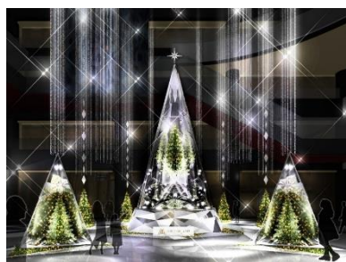
メインクリスマスツリー 「Infinity Wish Tree」イメージ

他にも、グランフロント大阪 ショップ&レストランのプレミアム賞品プレゼントキャンペーンなど、期間中に実施するさまざまなイベント等を通じて、進化し続けるうめきたエリアをさらに盛上げる、今年にふさわしい感動的なクリスマスをお届けします。