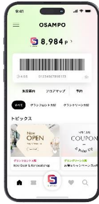
OSAMPO アプリ 画面イメージ