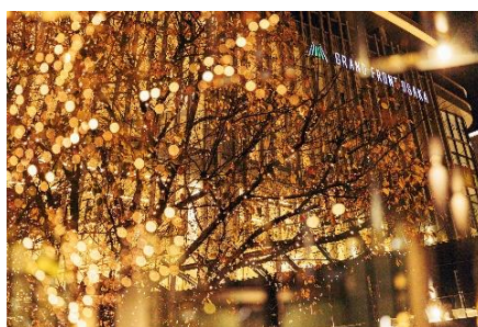
「Champagne Gold Illumination in UMEKITA」 過去実施時の様子