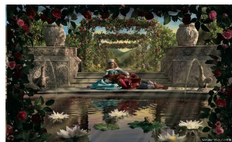
5巻:むかしむかし びじょとやじゅう