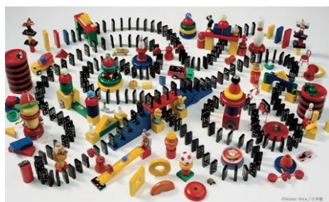
1巻:おもちゃばこ ドミノは うまく たおれるか