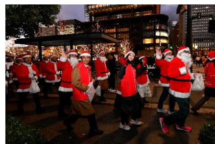
「Grand Santa Parade in UMEKITA」 イメージ