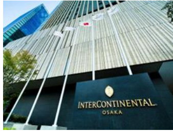
インターコンチネンタルホテル大阪宿泊券