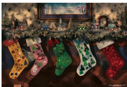
4巻:サンタクロース くつしたさげて まってます