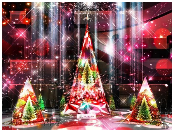
ライティングショー実施(イメージ)