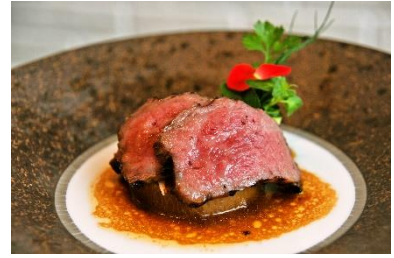
南館 8 階レストラン「チェサピーク」食事券 ※賞品はイメージです。