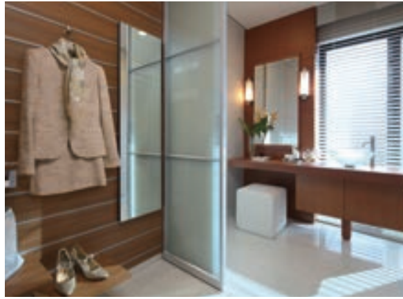
ホテルのように、クロゼットとメイクコーナーをインクルード。お出掛け前の時間もゆったりと、心地良く過ごせそう。(GM池下ザ・タワー/愛知県)