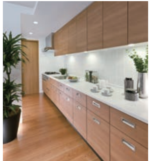
大人気の、ロングキッチンカウンター。家庭によっては食器棚が要らないほどで、食品庫やリビング収納としても活躍します。(GM猫洞通ヒルズ/愛知県)