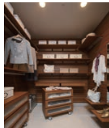
寝室に隣接させた、本格的なウォークインクロゼット。ワードローブも小物も見渡せる、まさにオシャレのための楽屋です。(GM池下ザ・タワー/愛知県)