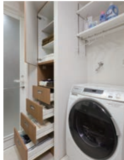
脱衣場のリネン庫には、タオル類はもちろん下着や部屋着までをらくらく収納。洗濯～たたむ～仕舞うまでの家事をサポートする収納もあります。(GM猫洞通ヒルズ/愛知県)