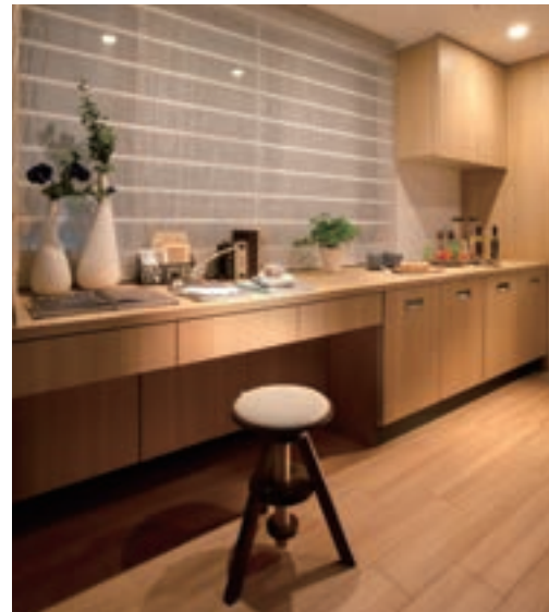
ロングキッチンカウンターの一部をデスクコーナーにした例。奥様の趣味のコーナーや家族のパソコンデスクとして、また子どもたちの勉強スペースとしての使い方も。(GM瑞穂松園町/愛知県)