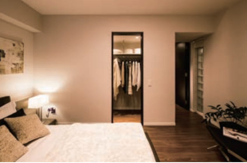
寝室がドレスアップ空間にもなるウォークインクロゼット。玄関にも収納空間があるので、その日着た上着やコートはここに持ち込まなくて済みます。(GM丸の内スタイル/愛知県)