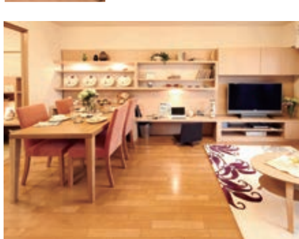
リビングの壁面全体が収納、その一部を書斎コーナーにした例。子どもたちを遊ばせながら仕事もできそうですね。(GM伊丹池尻 リテランティ/兵庫県)