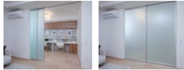
“魅せる収納。をメインにしたリビング。一見、収納が足りないようですが、実は同じ空間内にスライドドアつきの書斎コーナーが。来客時に見せたくない物はここにさっと仕舞って、ドアを閉めればOK!の計画です。(GM池下ザ・タワー/愛知県)