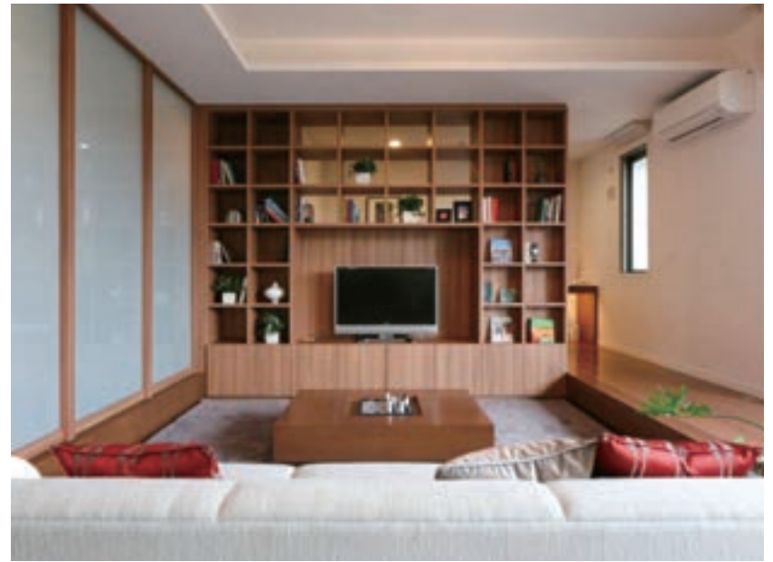
隣の部屋との間仕切り壁を、“魅せる収納”としたリビング。わが家らしい表情を作る楽しみがあります。見せたくない物や小さく細々とした物は下部の収納部にまとめて。(GM桜山スタイル/愛知県)