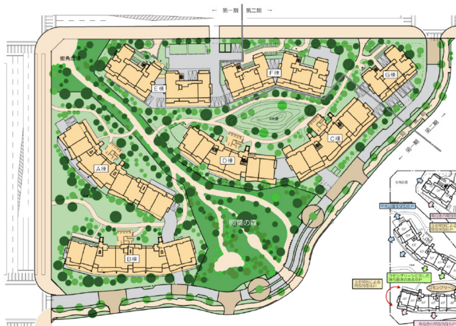
▲配置図兼1階平面図 SCALE 1:600