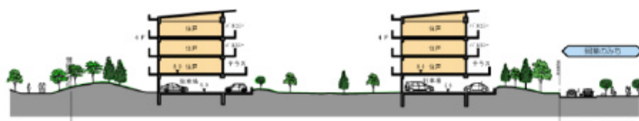
▲A-A断面図 SCALE 1:400