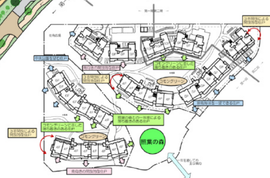
▲設計コンセプト図 SCALE 1:1000