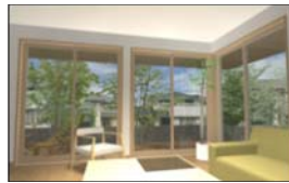
2方向に広がりのある軒下空間