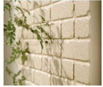
30年前の開発当時から変わらない 「ダイコンクリート」の古レンガ柄