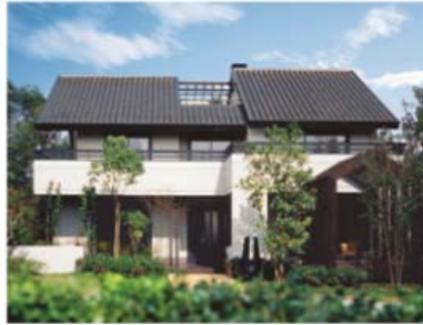
1987年「イズ・ステージ」 6寸勾配の切妻屋根の邸宅 1991年にグッドデザイン賞を受賞 基本デザインは今も変わっていない