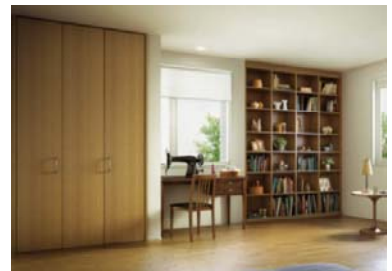
室内は収納や本棚などに有効活用

サッシを外壁面から25cm、または50cmセットバックさせ、「ダイコンクリート」外壁の重厚さを強調した、印象的なファサードが可能。