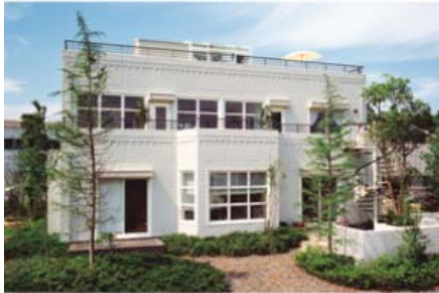
1984年「イズ・フラット」 耐火性、遮音性、耐久性を高めた 「ダイコンクリート」外壁をまとった 新たな都市型住宅として誕生

1984年、積水ハウスが独自に開発した最高級外壁材「ダイコンクリート」をはじめ採用した「イズ・フラット」が誕生しました。87年には深い軒に美しい切妻屋根の「イズ・ステージ」が登場。以後「イズ・シリーズ」として様々な商品を発表してきました。2014年に鉄骨戸建て住宅の構法を進化させた「NewBシステム」を「イズ・シリーズ」全てに導入し、高い耐震性を維持しながら、大空間や大開口の「スローリビング」を実現する設計自由度を高めました。30年にわたり、お客様や専門家から高い評価をいただいています。