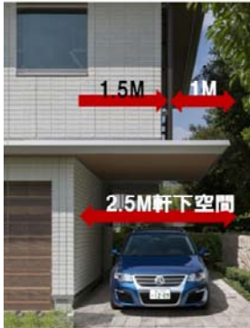
「1.5m床オーバーハング+キャノピー」

2階の1.5m床オーバーハングと1mのキャノピー（水平庇）を組み合わせた幅2.5mの軒下空間や、2方向に1mずつの「2方向床オーバーハング」を実現。余裕のある2階の居住空間を確保しつつ、軒下空間をカーポートやエントランスに有効活用しながら、ダイナミックな外観シルエットを可能にしました。また、2方向に広がる中間領域で内と外を緩やかにつなぐ「スローリビング」や車から玄関への雨に濡れないアプローチなどの快適性や機能性を高める提案が可能になりました。