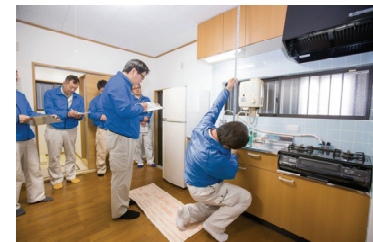
「リフォーム研修所」でのリフォーム専任技術者「リフォームディレクター」研修